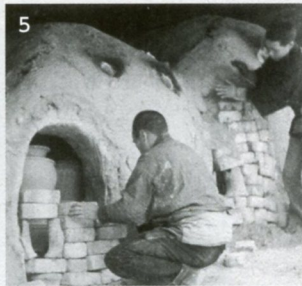
1.日本の民藝を愛し、各地を巡って貴重な映像を残した陶芸家バーナード・リーチ。グロスさんが撮影したものだ。(1975年)。2.リーチとも親交が深かった人間国宝・濱田庄司。『濱田庄司 益子にて』(1950年)。3.小鹿田を訪れた際のリーチと柳宗悦。大分県広報課が撮影した当時の映像の一部。『小鹿田焼 バーナード・リーチ、柳宗悦とともに』(1954年)。4.リーチが映像に残した益子での濱田の家族たちとリーチ。『日本旅行・朝鮮半島旅行』(1934年)。5.益子の登り窯の窯入れの様子。『益子焼』(1937年)。