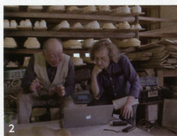
1.一子相伝の陶芸の里、大分県日田市小鹿田焼の映像の1コマ。当時の職人たちの手仕事の詳細や人々の暮らしが映されている。『民窯 小鹿田焼』(1957年)。2.グロスさんは、元は無声だった『民窯 小鹿田焼』のフィルムをデジタル修復し、当時を知る人々にインタビューして解説音声をつけていく。